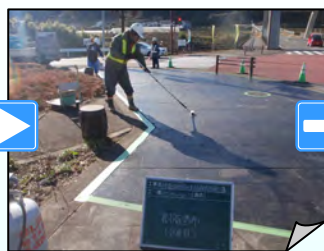
バインダ塗布(2層目)