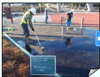
バインダ塗布(1層目)