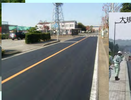
大規模施工には機械施工も可能です