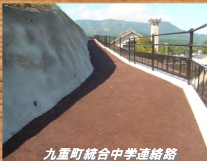
九重町統合中学連絡路