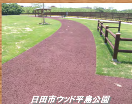
日田市ウツド平島公園